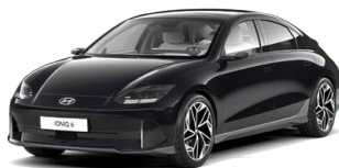
Abbys Black Pearl Perleťová Cena: 19 900 Kč