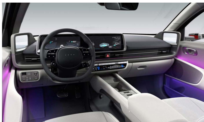
Šedý interiér – čalounění sedadel kůže – výhradně pro Style Premium