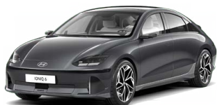
Nocturne Gray Matná metalická Cena: 24 900 Kč