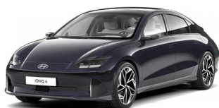
Biophillic Blue Perleťová Cena: 19 900 Kč