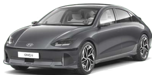
Nocturne Gray Metalická Cena: 19 900 Kč