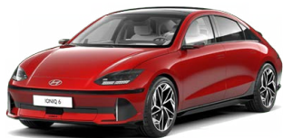
Ultimate Red Metalická Cena: 0 Kč