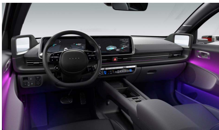
Černý interiér – čalounění sedadel kůže – výhradně pro Style Premium