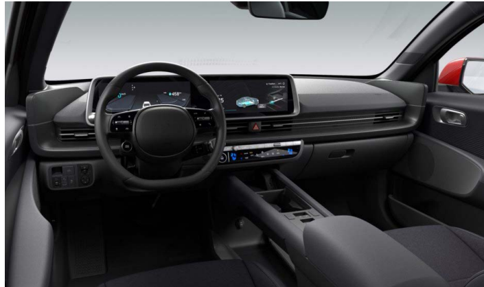
Černý interiér – čalounění sedadel v kombinaci látka/kůže – dostupné pro Smart, Style