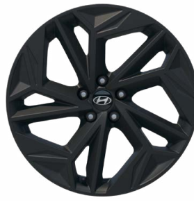
20" kola z lehké slitiny Black edition