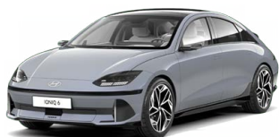
Transmission Blue Perleťová Cena: 19 900 Kč