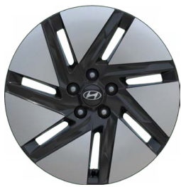
18" kola z lehké slitiny