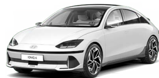
Serenity White Perleťová Cena: 19 900 Kč