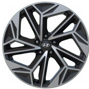
20" kola z lehké slitiny