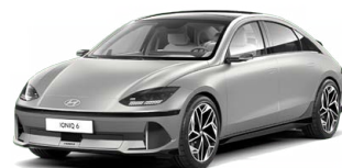
Gravity Gold Matná metalická Cena: 24 900 Kč